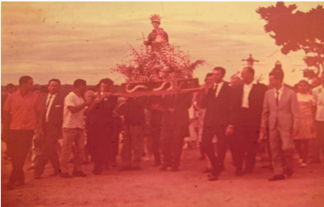
Imagem n. 03: Fi s na prociss o de Santo Antonio, na Pra a do Argiom, S/D.

A outra imagem a ser analisada, ao que tudo indica, trata-se da prociss o.