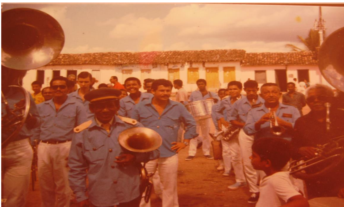
Imagem n.02. Filarmônica Lira Itaberabense, na Praça do Argoim, 1987.

A primeira trata-se de uma imagem dos músicos da orquestra filarmônica Lira Itaberabense.